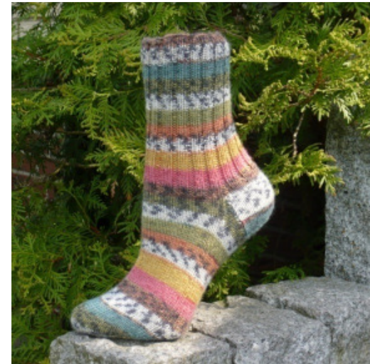
Flotte Socke 4fach Trend

... alles prima !!! ... alles Rellana !!!