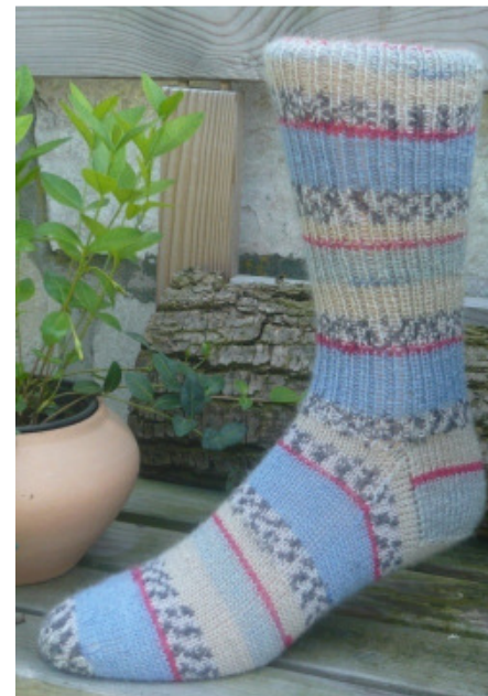
Flotte Socke 4fach Fresh

Unser bewährtes Sockengarn „Flotte Socke“ ist mit einer umfangreichen Farbpalette in Uni-, Melange-, Mouliné-, Colori- Farben sowie Musterbildend erhältlich.