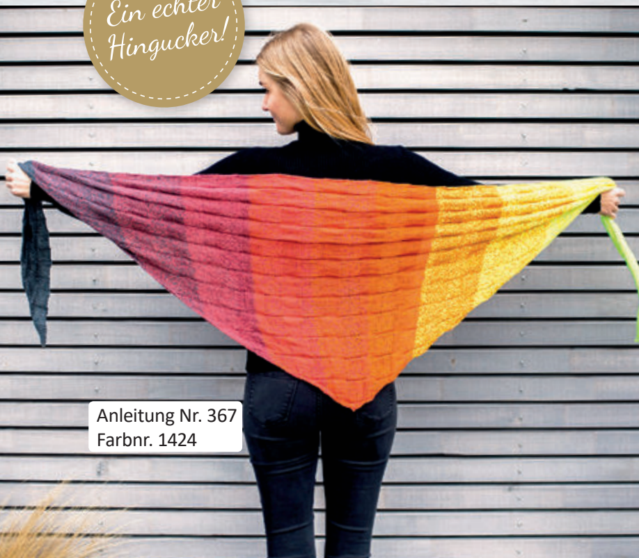
Anleitung Nr. 367 Farbnr. 1424