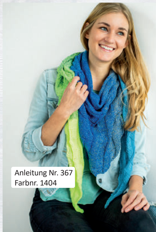
Anleitung Nr. 367 Farbnr. 1404